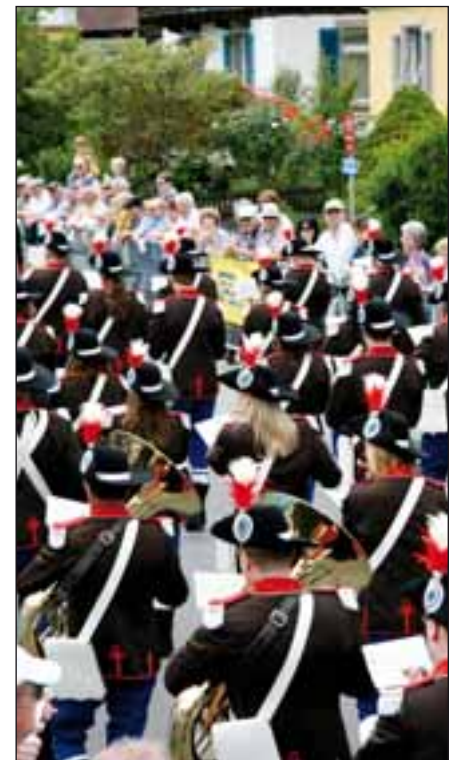
Die Harmonie-Musik Marbach auf der Marschmusikstrecke.

Willisau nicht anders. Einige Orchester wurden durch leichten Regenfall etwas handicapiert. Vier ausgewiesene Experten bewerteten die Marschierenden in sechs verschiedenen Kategorien (Musik und Marschdisziplin). Im besten Fall wären 60 Punkte möglich gewesen. Ganze 57,5 Punkte holte sich die Brass Band MG Rickenbach und wurde damit Sieger in der ersten Klasse. Nur fünf Vereine überraschten das Publikum mit sogenannten Evolutionen. Hier holte sich die Feldmusik Hochdorf die meisten Punkte. Ein Highlight während der Pause waren die Vorführungen der Bersaglieri Fanfara Lonate aus Italien.