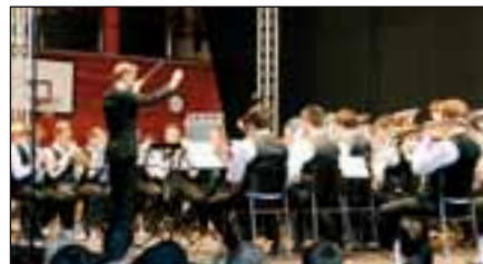
Eindrücklicher Vortrag der BML-Talents.

eine Abwechslung. So hätte man beim Vortrag des Chorals «Sleep» von Eric Whitacre durch das Jugendblasorchester der Stadt Luzern die berühmte fallende Nadel durchaus hören können.