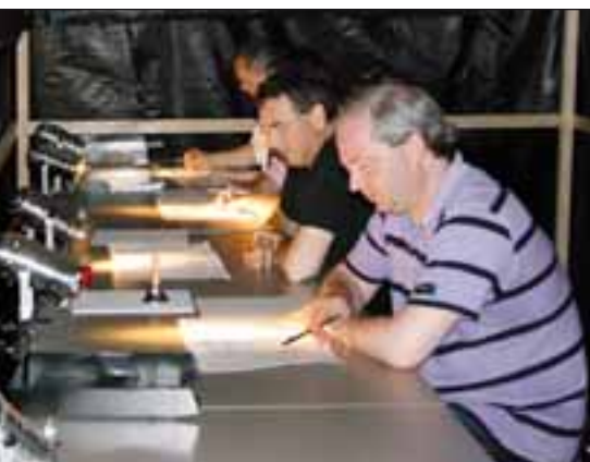
In der Höhle der Jury.