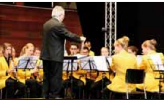
Das Jugendblasorchester der Stadt Luzern wurde Festsieger bei den Harmonieorchestern.