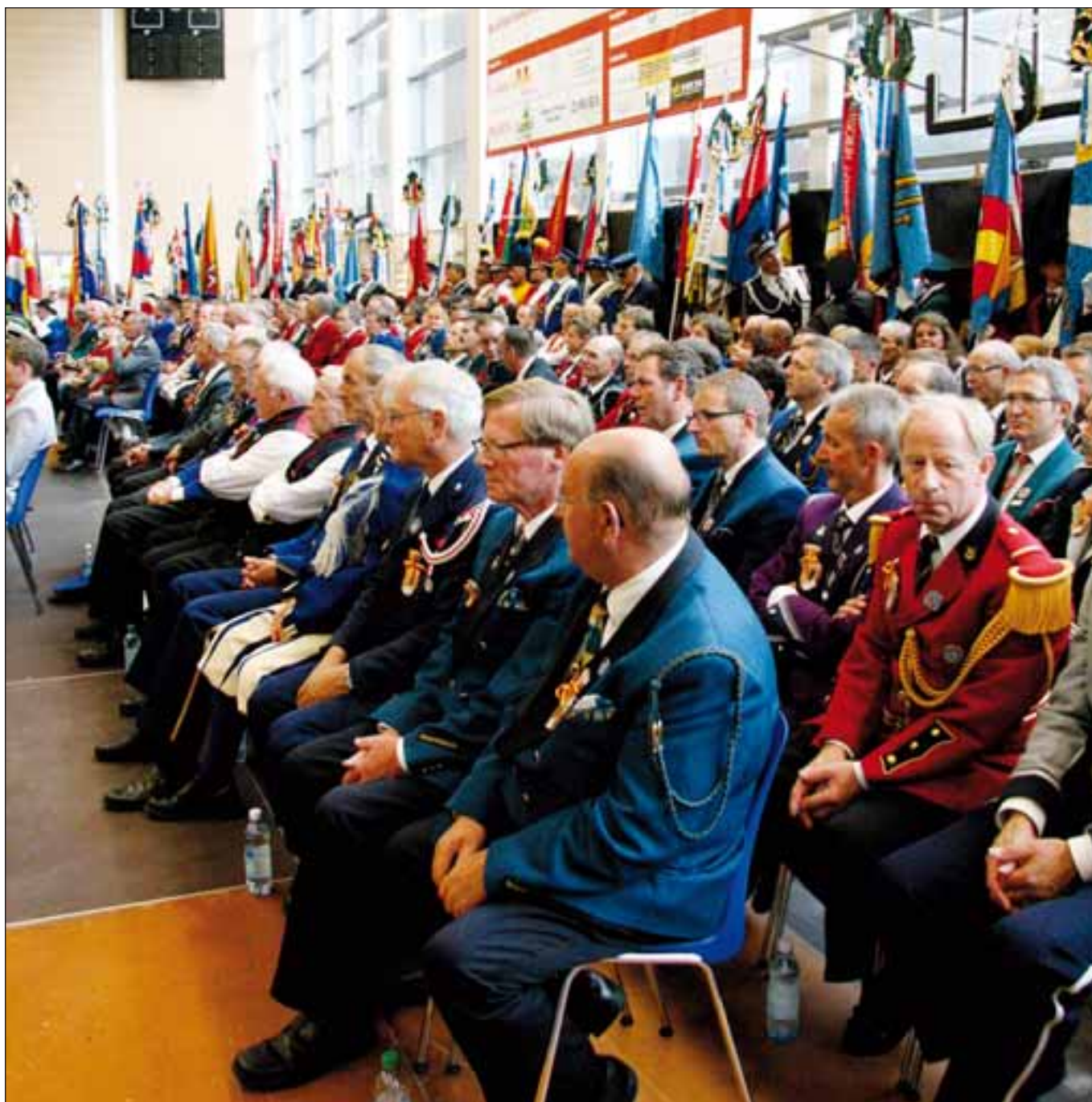
Die Veteranen warten auf ihre Medaille.