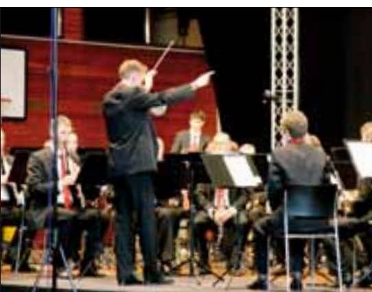
Harmoniemusik Kriens beim Wettspiel.

Absoluter Höhepunkt des Musikfests war natürlich der Einzug und die Ehrungen der Veteranen, die verschiedenen Festreden und am Schluss die mit Spannung erwartete Rangverkündigung. Je nach dem: Freudentaumel oder etwas lange Gesichter.