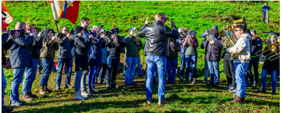
Die Feldmusik Buttisholz gab mehrere Platzkonzerte auf der Rütliwiese zum Besten.

Als das Schiff beim Rütli ankam, folgte bereits der erste Auftritt. Bei wenig Tageslicht und noch weniger Taschenlampen spielte die Feldmusik den «Bundesrat Gnägi-Marsch» und begrüsst damit die Schützinnen und Schützen, die mit dem nächsten Schiff ankamen. Dies war der Auftakt eines Tages, an dem noch viele weitere Ständchen folgten. Nach einer zweiten Runde Kaffee wurde bei der Berner Sektion gespielt – natürlich eröffnet mit dem Marsch «Gruss an Bern». Als Dank für den Auftritt gab es eine Käse-Fleisch-Platte, frischen Zopf und ein