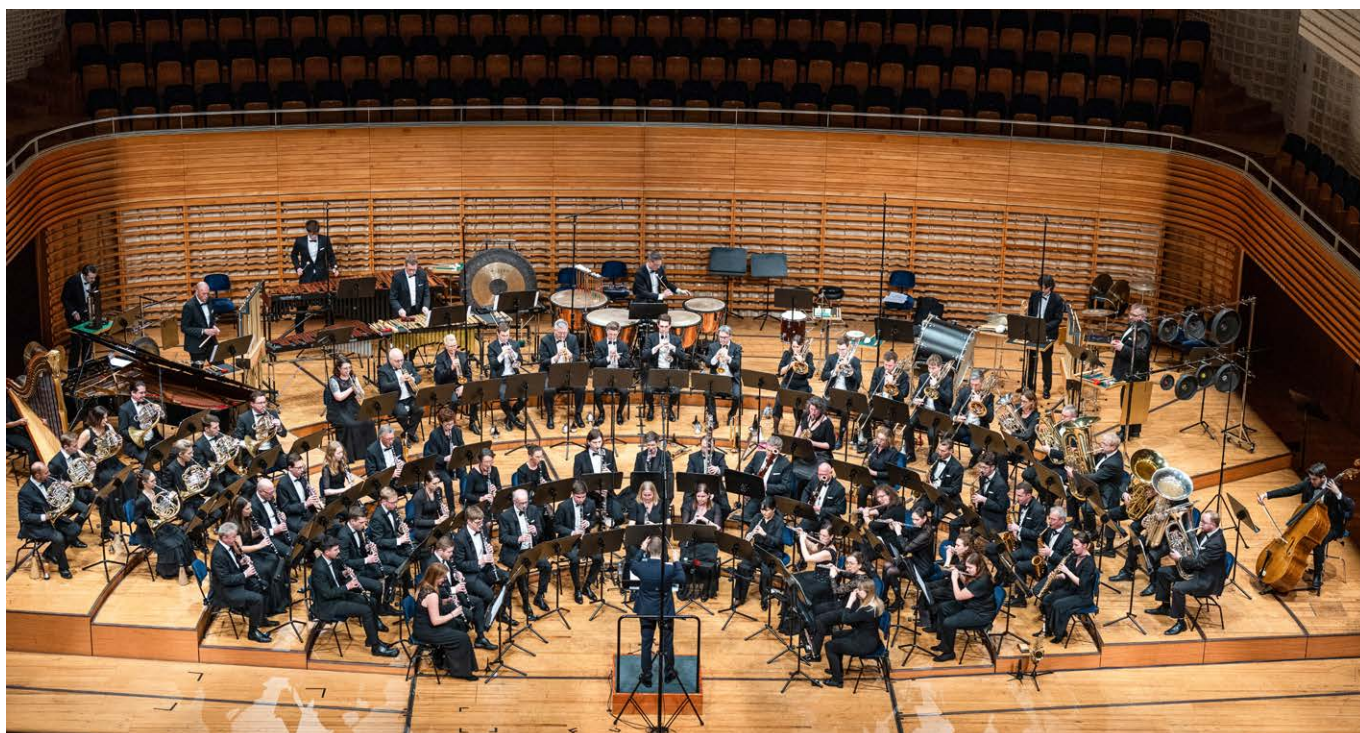
Die Stadtmusik Luzern präsentiert an ihrem kommenden Konzert ein neues Werk aus Übersee.

Winterkonzert «The isle is full of noises». Blasorchester Stadtmusik Luzern. Samstag, 24. Januar 2026, um 19.30 Uhr im KKL Luzern. Tickets unter www.stadtmusik-luzern.ch