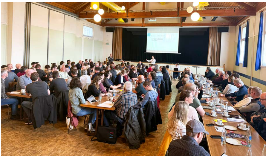
Die Präsidentenkonferenz fand im Gasthaus St. Mauritz in Schötz statt.