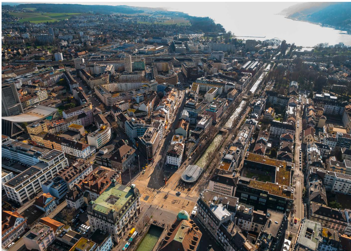
In der Stadt Biel findet vom 14. bis 17. Mai 2026 das Eidgenössische Musikfest statt.

An einem Eidgenössischen Musikfest steht natürlich die Musik im Vordergrund. Die Wettbewerbe finden in 13 Konzertlokalen statt, verteilt auf die ganze Stadt. Diese werden ab dem zentralen Festplatz jeweils mit dem öffentlichen Verkehr erreicht, um ein Verkehrschaos zu vermeiden. Die Einspiellokale sind bei allen Konzertlokalen in