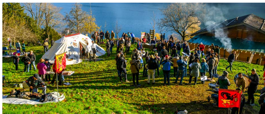
Beim Rütli-schiessen herrschten perfekte Bedingungen für die Schützen und die Musizierenden.

Mit dem Schiff ging es zurück nach Luzern und von dort aus mit dem Car nach Hause. Der Tag war lang und die Gesichter müde, aber das Erlebte einzigartig. Noch lange wird man vom 162. Rütli-schiessen erzählen und von den vielen tollen Momenten schwärmen. Die Feldmusik Buttisholz ist dankbar, dass sie diesen besonderen Anlass zum zweiten Mal musikalisch begleiten durfte. Ein besonderer Dank gilt dem Schützenverein Buttisholz sowie den Stadtschützen Luzern.